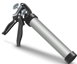
PISTUL EXTRUDOR PENTRU CARTUSE 533 / 600 CC a fi utilizat pentru următoarele produse: