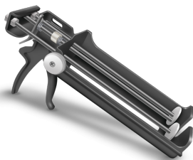
PISTUL EXTRUDOR PENTRU CARTUSE BIMIX 600 CC a fi utilizat pentru următoarele produse: