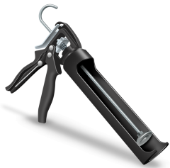
PISTUL EXTRUDOR PENTRU CARTUSE 300 CC a fi utilizat pentru următoarele produse: