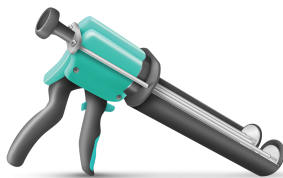
PISTUL EXTRUDOR PENTRU CARTUSE BIMIX 470 CC a fi utilizat pentru următoarele produse: