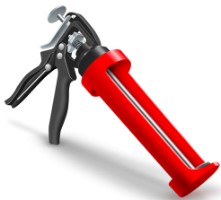
PISTUL EXTRUDOR PENTRU CARTUSE 400 CC a fi utilizat pentru următoarele produse: